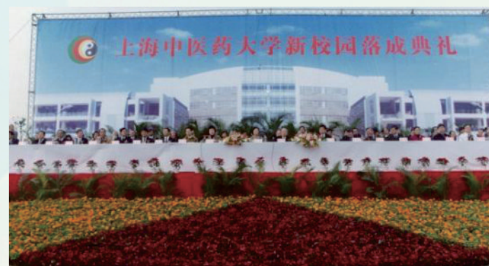
名譽校長吳階平在新址落成典禮上發言

2003年11月27日，新址落成典禮隆重舉行。全國人大常委會原副委員長、我校名譽校長吳階平出席典禮並講話，典禮由校黨委書記張建中主持、校長嚴世芸致詞並介紹新址籌建情況。