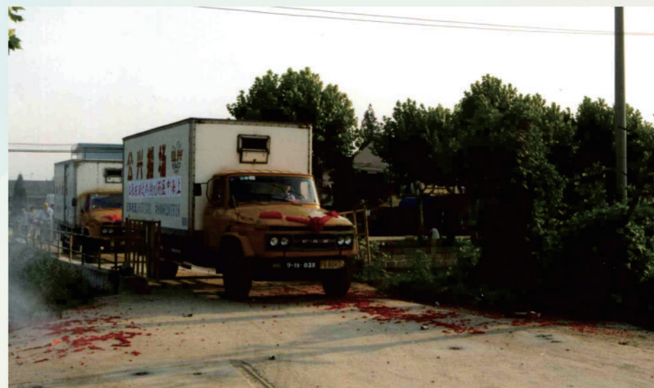
搬场车驶入张江校区

2003年10月6日，学校2003-2004学年第一学期在新校区正式开学。10月17日，开学典礼在新校区举行，由副校长童瑶主持，近3000名师生参加。这是学校第一次在新校区举行开学典礼。