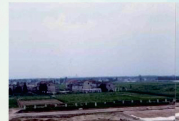
破土動工前的張江校區原貌