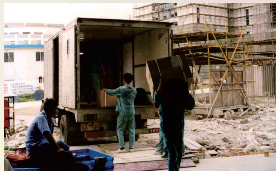
第一批物品搬入尚未拆除脚手架的行政楼