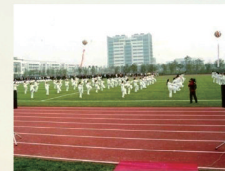
師生的太極拳表演