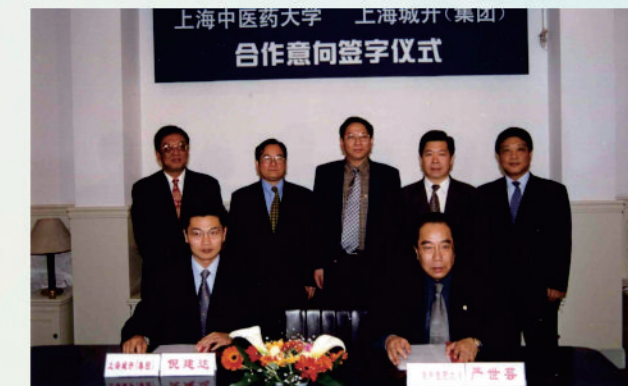
校领导与上海开城集团洽谈学校整体搬迁合作事宜