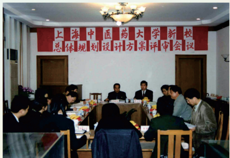
张江校区总体规划设计方案评审会议

上海市政府和浦东新区政府有意向在张江高科技园区内接纳高等院校。学校抓住机遇，向市政府提出“东迁”张江高科技园区的申请。2000年9月13日，市政府做出决定：上海中医药大学迁建浦东张江高科技园区，同时迁建一所附属医院，以适应大学教学实习所需，并决定浦东新区在张江高科技园区提供500亩土地，其中校园建设400亩无偿使用，学生生活区按市场运作规则开发性使用。