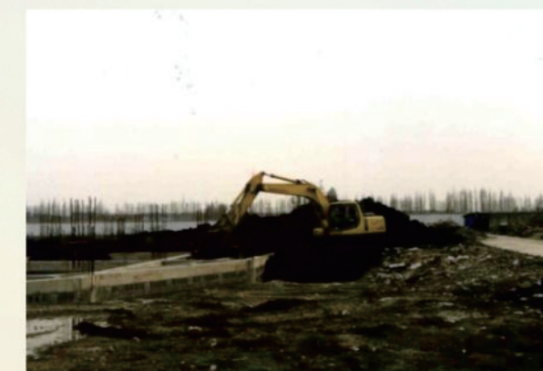
張江校區施工建設現場