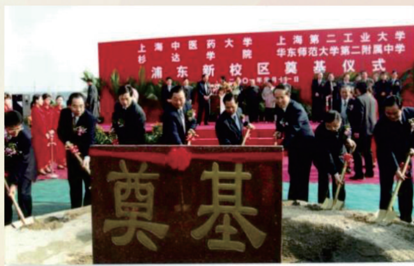
市領導與學校領導為學校新校區奠基揮鍬

按照“前瞻性、超前性”的設計原則，對中體設計方案面向國內外招標，經過反復論證、評審，確定以美國GENSLER建築設計事務所為主設計方，上海建築設計院有限公司為配合方，組成項目設計聯合體，形成新址建設方案：以遠志大道和仲景干道兩條干道構成縱橫交叉的總體格局。