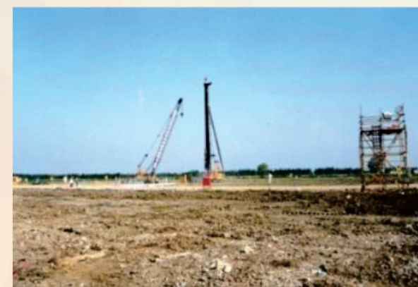
張江校區建設工地