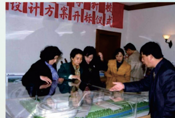
教职工参与讨论 张江校区设计方案