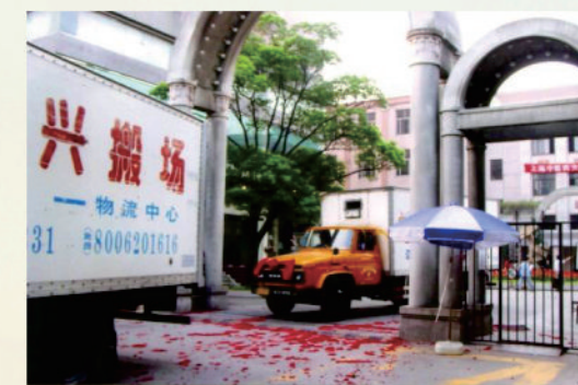
搬场汽车陆续驶离零陵路校区