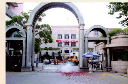
第一辆搬场汽车驶离零陵校区校门