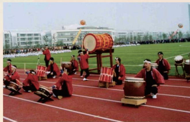
日本木野市青年正在演出