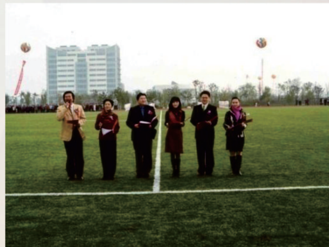
上海东方电视台主持人朗诵表演