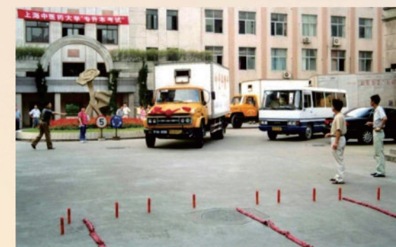
第一辆搬场汽车准备出发