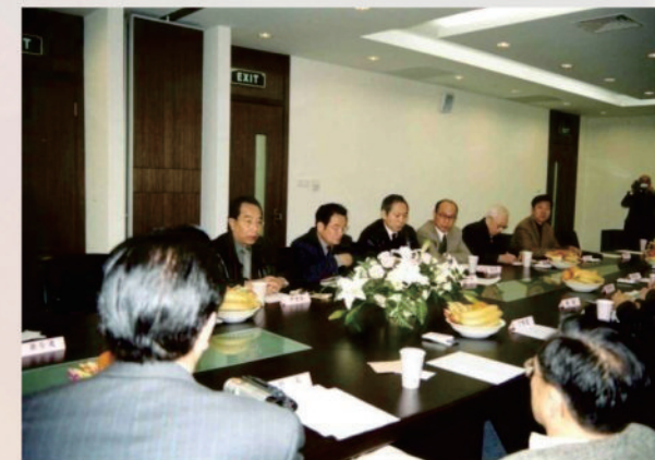
學校領導接待參加新校區落成典禮來賓

美國、法國、德國、新加坡、馬來西亞等國有關大學和合夥企業的代表，海內外中醫教育機構負責人、泰國衛生廳有關官員，英國駐滬領事館有關官員等150名外國朋友也參加典禮。