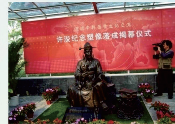
新校區落成典禮活動中舉行朝鮮御醫許浚紀念塑像落成揭幕儀式