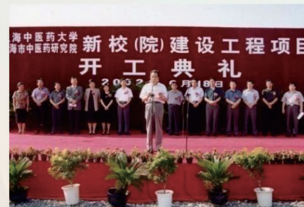
新校(院)建設工程項目開工典禮